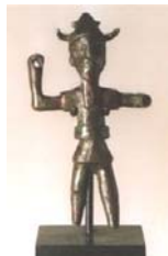
Estatua de Baal encontrada na palestina.

O povo da Palestina não estava organizado em fortes nações. Na época de Josué, formavam um conglomerado de pequenas cidades-estados (pequenos reinos ao redor de suas cidades fortificadas), que normal-