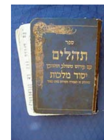
Bíblia Hebraica Torá, Profetas e Escrituras

povo de Israel e a prática de seus preceitos e de sua Vontade.