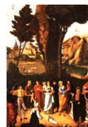
Julgamento da causa das duas prostitutas por Giorone (Século XIV).

No final do seu reinado Salomão conheceu adversários mais poderosos. Foram eles Hadade, o edomita; e Rezom, filho de Eliada. Mas o principal oponente de Salomão foi Jeroboão, que pela palavra do Senhor não teve maior impacto no reino de Salomão, mas vai ser pivô na divisão da nação de Israel.