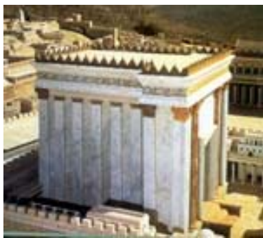
Templo de Salomão

Israel começa a desfrutar dos benefícios das campanhas militares de Davi. Tem paz em suas fronteiras e iniciou um grande período de prosperidade econômica. Infelizmente esta prosperidade não foi distribuída de forma balanceada na sociedade. Criaram-se castas sociais, com os remanescentes dos cananeus sendo obrigados a trabalhos escravos.